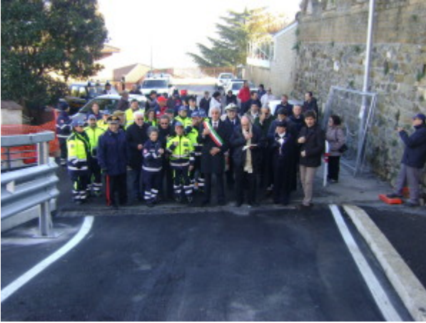
Inaugurazione viadotto Monte Porzio Catone