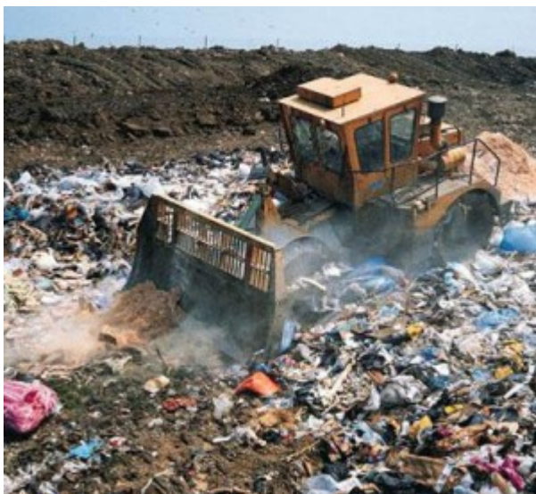
La discarica di Roncigliano ad Albano Laziale