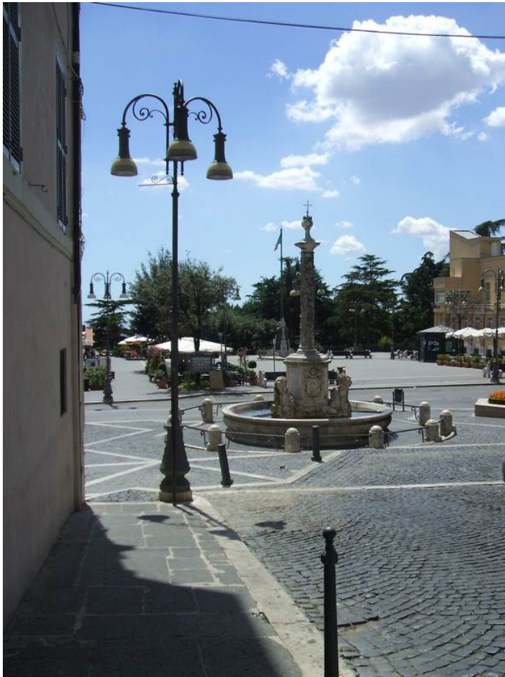
Piazza Tommaso Frasoni a Genzano di Roma