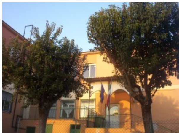
Istituto scolastico Antonio Gramsci di Pavona

SPORT – Domenica 11 maggio, all'interno del progetto promosso da Meta Magazine e Sporting Pavona "SportiviXCultura", prenderà il via, sotto l'egida della Federazione Italiana Pallavolo (FIPAV), il Torneo Pallavolistico dei Castelli Romani e Litorale Roma Sud Edizione Estate 2014. Il calendario dell'evento prevede lo svolgimento di 198 gare distribuite in 22 giornate ed il coinvolgimento di tutte le Categorie Giovanili, Open e Master di volley. L'importante Manifestazione sarà svolta nei week-end primaverili ed estivi, e vedrà, come prevede il progetto SportiviXCultura, coinvolte decine di Società e centinaia di Atleti. Oltre alle regolari competizioni agonistiche ci saranno anche numerosi convegni a tema e la partecipazione degli alunni dei Progetti Volley Scuola ai micro tornei di Minivolley. Sono già 15 le società di pallavolo che hanno aderito al progetto e che di volta in volta animeranno le tappe del torneo, sino alla celebrazione delle finali all'interno dei Giochi dei Castelli Romani.