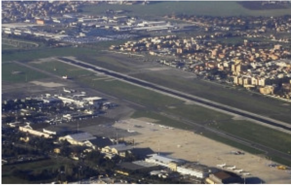
Aeroporto Pastine di Ciampino

La presentazione avvenuta lo scorso 24 luglio presso la Biblioteca Nazionale Centrale di Roma dell'Annuario dei dati ambientali e il Rapporto Rifiuti dell'ISPRA (Istituto Superiore per la Protezione e la Ricerca Ambientale), ha riacceso le preoccupazioni circa lo stato di salute nel nostro territorio.