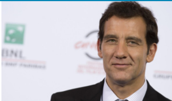
Serio impostato, in perfetto british style, Clive Owen

festival del Cinema di Roma per presentare The Knick , la nuova TV series diretta dal regista americano Steven Soderbergh, premio Oscar nel 2001 per Traffic . La serie è un medical drama che ha debuttato ad agosto negli USA e andrà in onda in autunno sul canale SKY Atlantic, e segue le vicende del dottor John Thackery, personaggio inquieto che ama la cocaina e detesta la concorrenza. Alla fine dell'800, in un'epoca caratterizzata da elevati tassi di mortalità e assenza di antibiotici, Thackery regna in contrasto fra le mura del Knickerbocker Hospital di New York, dove è noto semplicemente come The Knick . Primo lavoro realizzato da Soderbergh dopo aver pubblicamente annunciato il suo ritiro dal mondo del cinema, The Knick è una serie in dieci puntate dirette con magistrale inventiva. La serie è un'immersione gotica immersa nel lato più oscuro e inquietante del ventesimo secolo e in fatto di sperimentazione si avvicina a opere sacre come Gangs of New York di Scorsese. Il personaggio, medico brillante e tossicomane, è ispirato dalla figura del chirurgo statunitense William Stewart Halsted, medico che per motivi etici aveva la consuetudine di sperimentare i farmaci (tra cui la cocaina, tra i primi anestetici locali) prima su sé stesso, diventando così farmacodipendente.