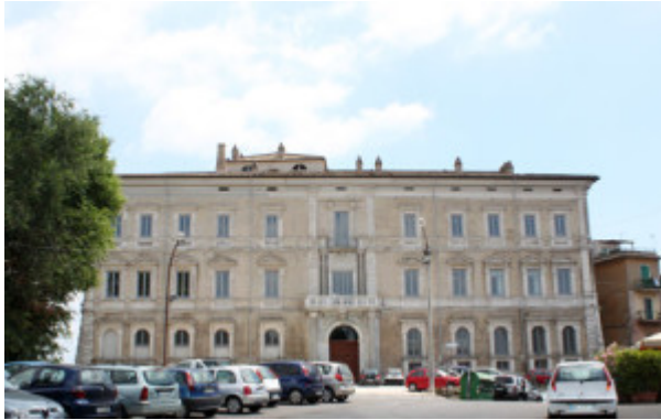
Palazzo Sforza Cesarini a Genzano di Roma