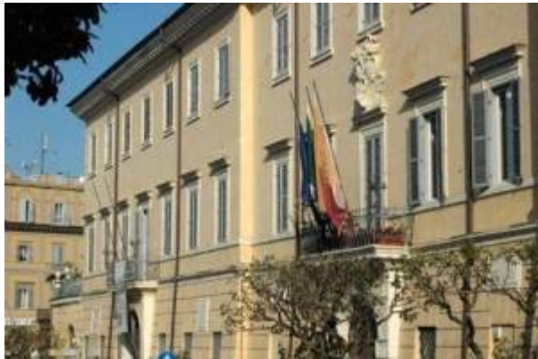
Palazzo che ospita il Comune di Frascati

Ludopatie e i giovani del territorio è il nome del progetto di ricerca che l'Amministrazione Comunale di Frascati ha accolto, su proposta progettuale elaborata dallo Sportello Intercomunale Antiusura, di cui è socio fondatore, e avviato a dicembre all'interno delle scuole, per valutare il fenomeno della ludopatia in età giovanile e mettere in atto tutti gli strumenti a disposizione per facilitare una presa di coscienza in coloro che ne sono affetti senza esserne a conoscenza. E comunque per avviare una campagna di sensibilizzazione preventiva tra i giovani in età scolare sui rischi che il gioco d'azzardo può indurre se non si attivano i necessari filtri critici. Il primo passo da parte dell'Ufficio Servizi Sociali è stato quello di avvertire, in via preventiva, gli Istituti scolastici del territorio, compreso quello di Villa Sora, per sensibilizzare i Dirigenti Scolastici. È così iniziata la fase centrale di raccolta dati e al termine di tale fase è intenzione dell'Amministrazione Comunale presentare i risultati della ricerca realizzando un evento pubblico.