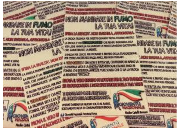
Volantino Gioventù Nazionale