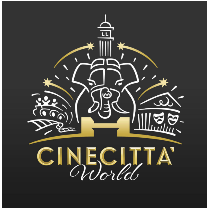
Il logo di Cinecittà World