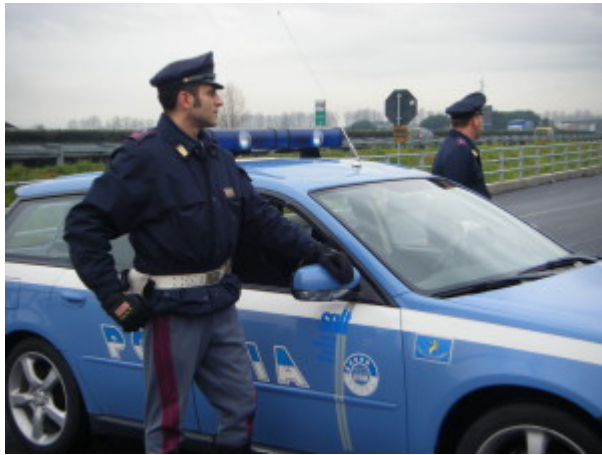
Polizia di Stato