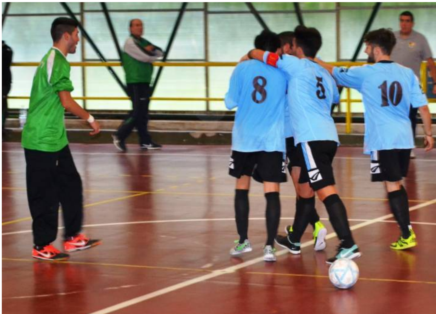
Esultanza tra i giocatori del Forte Collevero calcio a 5

La Forte, sull'onda dei risultati positivi delle ultime quattro gare, cerca lo strappo per riagganciare la zona Play off e superare in classifica gli aeroportuali. Il Città di Ciampino per rimanere nella parte altissima del tabellone e confermare quanto di buono fatto sino ad ora. Sulla carta due neopromosse, ma nella realtà nessuna delle due compagini firmerebbe, ad oggi, per una "salvezza tranquilla". Scontro quindi tra due formazioni che possono, e vogliono, dire la loro in questa stagione. Per la cronaca non si gioca al Palaromboli, perché il Palazzetto è non è disponibile in questo week end e si emigra nella "tana" dei rivali del Città di Collevero, scendendo in campo sul gommato di Via degli Atleti.