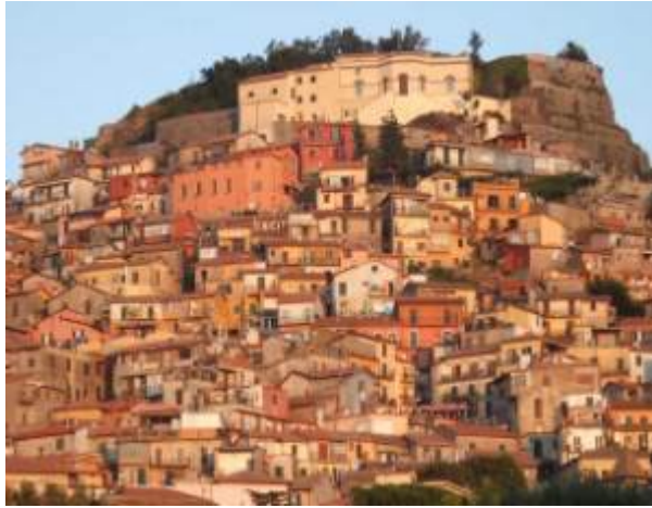
Rocca di Papa

“Da rivedere l’aggiudicazione del servizio direzione scolastica. Nessun disagio per i cittadini” esordisce così nella nota l’ufficio stampa del Comune di Rocca di Papa