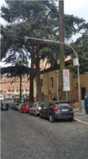
Corso Italia a Frascati

Frascati, grazie alle società sportive anche quest'anno sarà garantita l'accoglienza gratuita ai ragazzi meno abbienti.