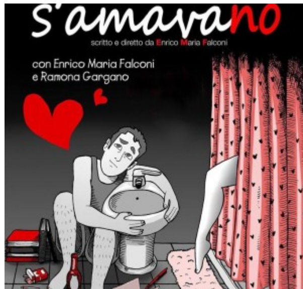
S'Amavano – Locandina