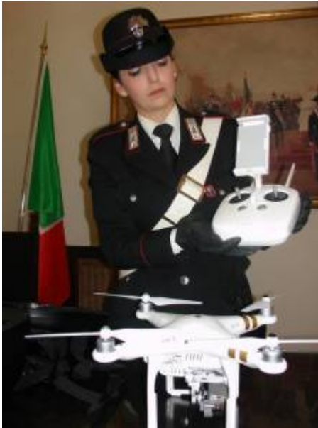
Al Colosseo i Carabinieri bloccano stranieri intenti a fare riprese con un drone