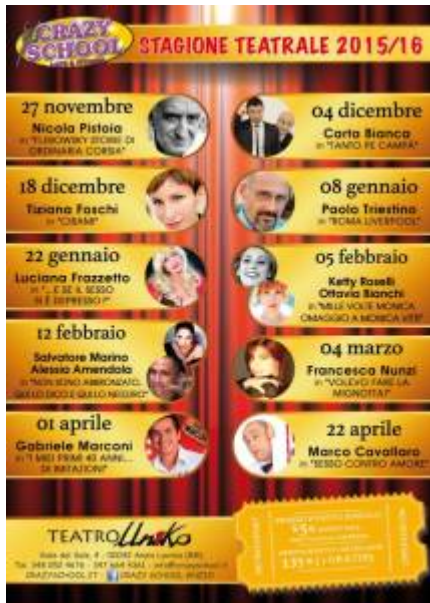
Cartellone Crazy School 2015/2016