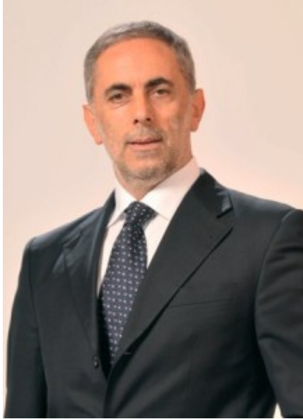
Pasquale Boccia Sindaco Rocca di Papa

In merito alle ultime vicende mediatiche che hanno interessato la Casa Famiglia delle Suore Carmelitane di Rocca di Papa, in riferimento a episodi che si sono verificati in passato e su cui farà luce la Magistratura, il sindaco del Comune di Rocca di Papa, Pasquale Boccia, è voluto intervenire con delle precisazioni.