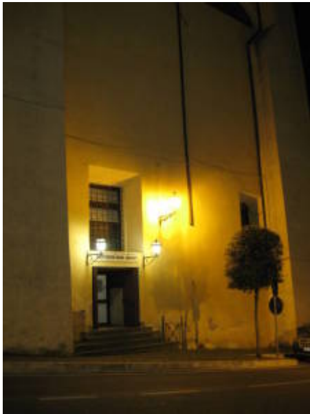
Auditorium Guglielmo Grassi a Marino