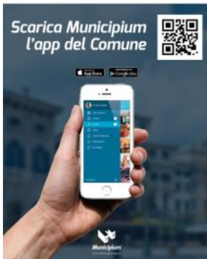
App Municipium al Comune di Colonna

Per comunicare con i cittadini in modo semplice e innovativo, il Comune di Colonna ha scelto Municipium, un'app gratuita e intuitiva per dispositivi smartphone e tablet.