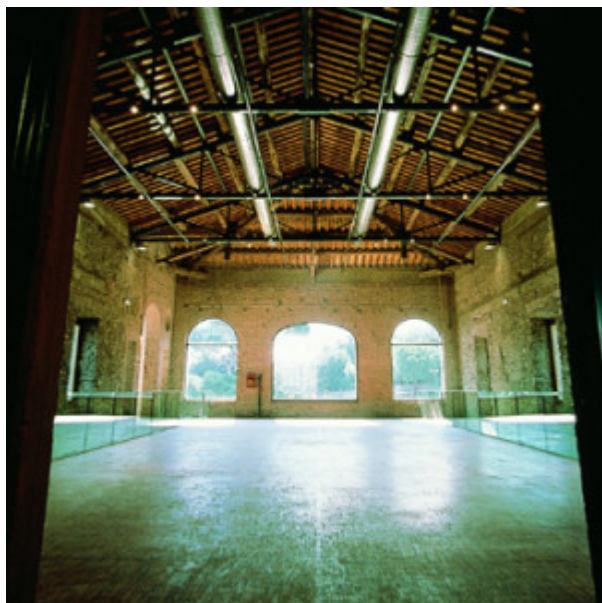
Scuderie Aldobrandini a Frascati spazio espositivo

La Biblioteca comunale di Frascati ha istituito da anni, presso la sua sede, l'ARCHIVIO SCRITTORICASTEELLI ROMANI, che raccoglie le opere degli Autori nati o residenti in uno dei comuni dei Castelli Romani. Si tratta di un importante fondo che ha il valore di un censimento, in costante aggiornamento, di quanto viene prodotto nei diversi ambiti letterari: narrativa, poesia, storia, archeologia e saggistica su tutto il territorio dei Castelli Romani