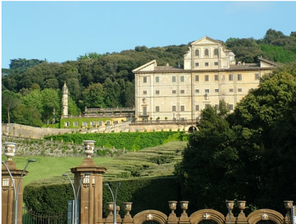
Villa Aldobrandini a Frascati