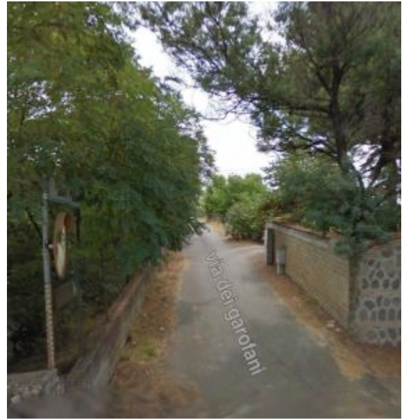
Via dei Garofali a Cancelliera

Avviati ieri mattina, lunedì 30 maggio, i lavori per l'installazione della pubblica illuminazione su via dei Garofani, in località Cancelliera. I lavori dureranno circa un mese. Si tratta di un intervento indispensabile e tanto atteso dai residenti, come sottolineato dal Vice Sindaco con delega ai Lavori Pubblici, Maurizio Sementilli: «Nella zona di Cancelliera stiamo completando diversi interventi di urbanizzazione; l'illuminazione di via dei Garofani si inserisce in questa programmazione». Sul popoloso quartiere a ridosso fra via Nettunense e via Ardeatina, Sementilli ha poi aggiunto: «Si tratta di una realtà che migliora giorno dopo giorno in termini di servizi al cittadino. A dimostrarlo anche la recente inaugurazione, lo scorso settembre, del nuovo polo scolastico di via Pantanelle, con il quale abbiamo raddoppiato le aule per i ragazzi, rispetto alla struttura preesistente».