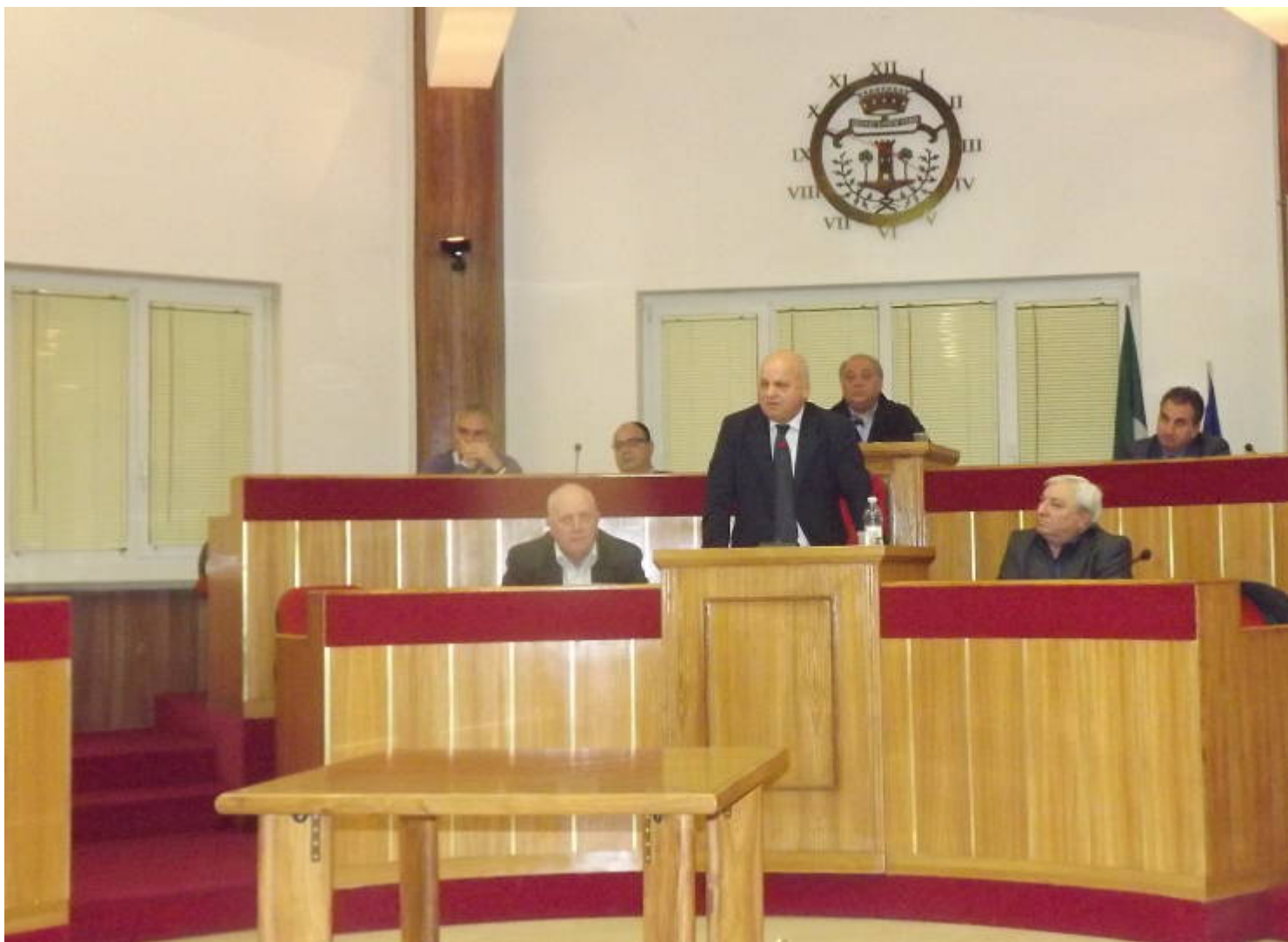
Intervento in Consiglio Comunale del sindaco di Lariano Maurizio Caliciotti