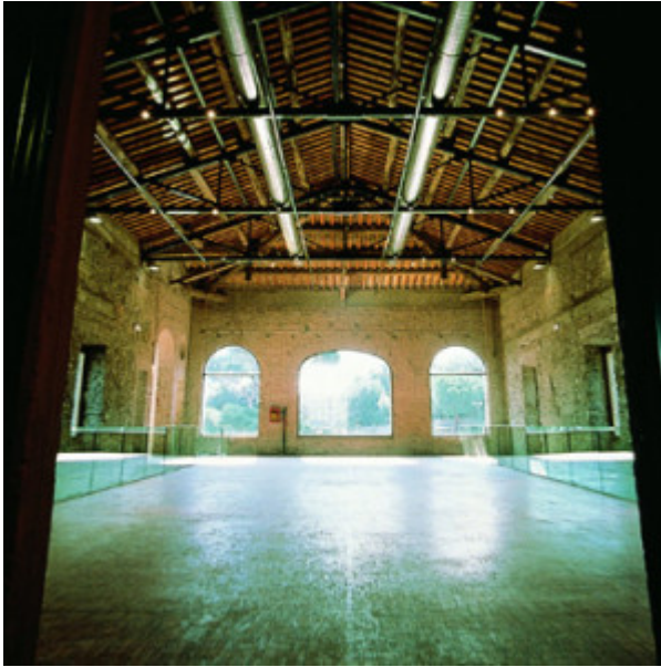
Scuderie Aldobrandini a Frascati spazio espositivo