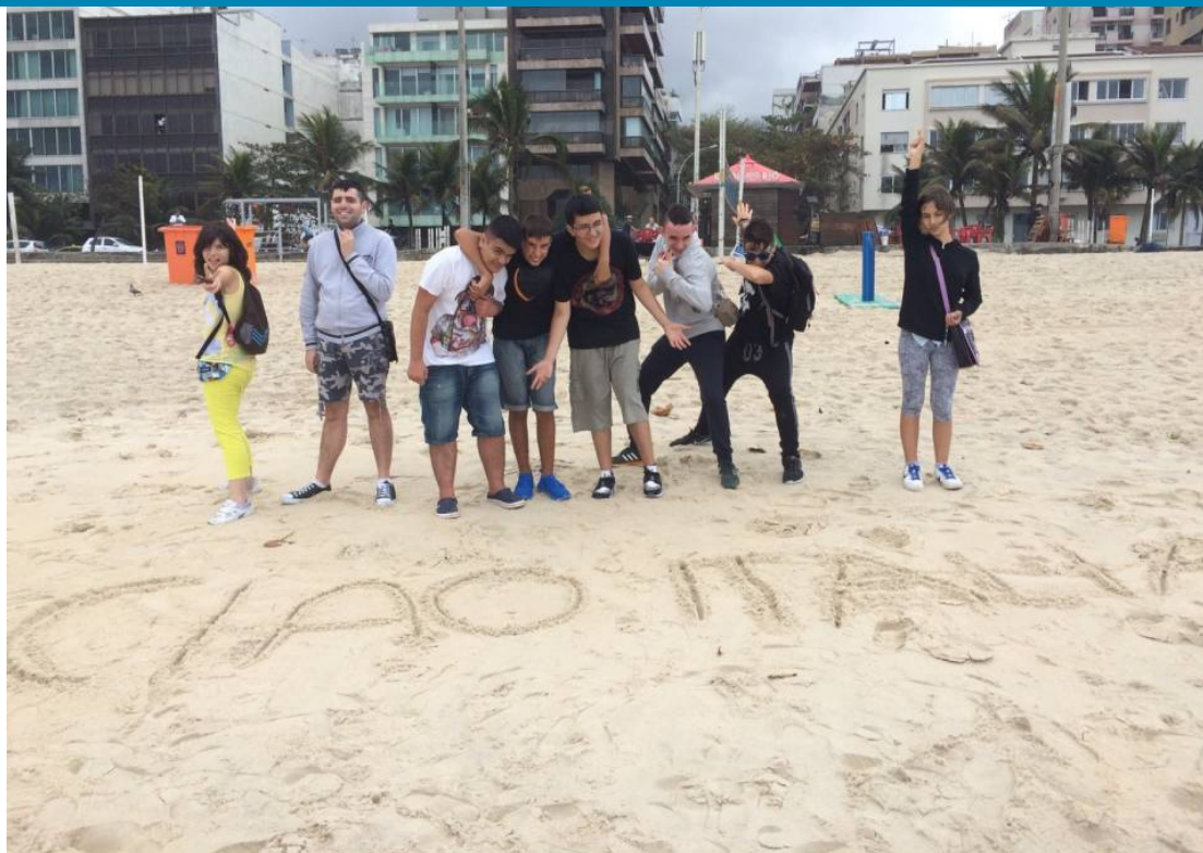
Sono atterrati a Rio lunedì