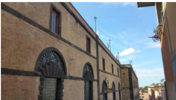
Mura dette del Valadier a Frascati

Prosegue a Frascati, sino a domenica 30 ottobre, all'interno delle Mura del Valadier, la manifestazione fieristica "Prima o poi ti sposo". A condurre l'evento un terzetto d'eccezione: Manila Nazzaro, Anthony Peth e Serena Gray. Saranno curati, tra focus, stand ed eventi, tutti gli aspetti relativi all'organizzazione del matrimonio: dall'abito della cerimonia alla fotografia, dal beauty al viaggio di nozze, dalle bomboniere alle decorazioni floreali. Con un'attenzione particolare al mondo "curvy", in tutte le sue forme.