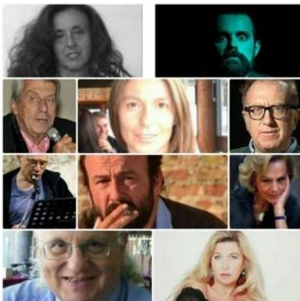
L'incontro Letterario di ieri e di oggi

Nella suggestiva cornice dell'Auditorium di SantaCeterina– Piazzetta Botter (Treviso) il giorno 5 novembre alle ore 16.30 avrà luogo la Cerimonia diPremiazione dei vincitori del Premio Letterario “L'incontro Letterario di ieri e di oggi”, giunto allaQuinta edizione e ideato, organizzato e promosso daEDIZIONI DIVINAFOLLIA. Il Presidente onorario delPremio è il compianto scrittore Alberto Bevilacqua.