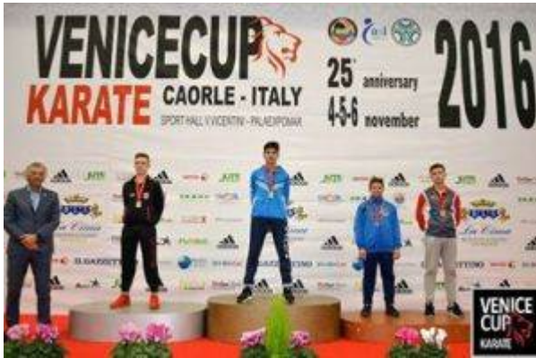
Toukon Velletri alla Venice Cup

“4-6 novembre. In scena a Caorle, la 25° edizione della “ Venice Cup”, una delle più rappresentative competizioni di livello internazionale di karate, sia kata che kumite. Circa 2000 atleti partecipanti venuti da ogni parte, molti dei quali atleti delle diverse nazionali per un evento che si svolge da sempre in due palazzetti dello sport confinanti nei quali vengono allestiti ben 13 tatami monitorati da telecamere che mandano in onda su di un apposito canale Youtube tutta la manifestazione – inizia così la nota del Toukon Velletri.