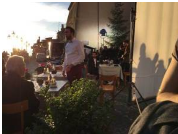
Salah a Nemi