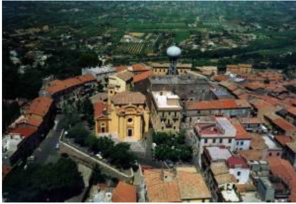
Panorama del Comune di Colonna