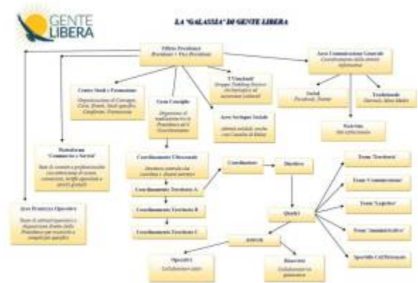
Organigramma Gente Libera