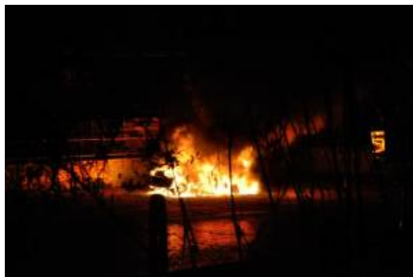
Esplosione ad Ariccia 14 febbraio 2017

Alle 18:30 di Martedì 14 Febbraio, i residenti delle villette di via Rufelli, nel comune di Ariccia, non hanno certo avuto bisogno di alcun avviso formale per evacuare le proprie case. Un rombo, infatti, si è udito tra gli abitati, sulla cui origine i Vigili del Fuoco devono ancora formulare una risposta definitiva. Che, però, sia stato il gas di una bombola, come si dice, o altro, a provocare lo sventramento della palazzina al civico 47 della strada, di sicuro il risultato è impressionante. Al conto già nutrito dei feriti si aggiunge l'estrazione di una coppia viva dalle macerie, certo non un brutto avvenimento, ma certo segno di una situazione ancora in pieno svolgimento. Intanto, tra pattuglie e unità cinofile al lavoro, strada chiusa, residenti evacuati e conto delle vittime, questo San Valentino rischia di essere memorabile nel più macabro dei modi per i residenti. Novelli terremotati senza terremoto, si riservano almeno, a differenza di questi ultimi, di sperare che il destino abbia esaurito in quell'esplosivo attimo quel che ha in serbo per loro.