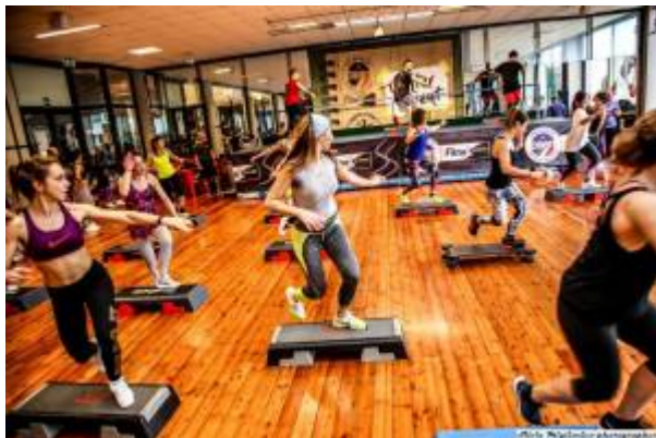
Winter Event 2017