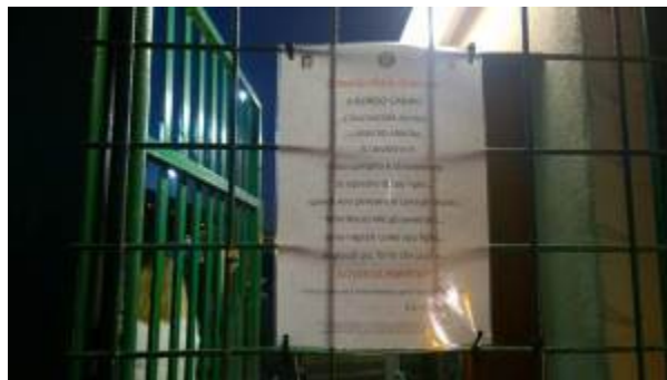
Codice comportamento per i genitori dei ragazzi del Le Mole calcio a Marino