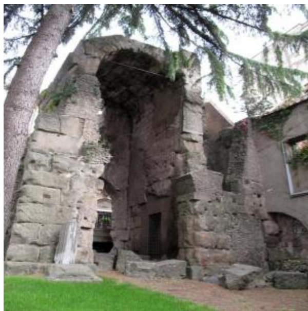
Tomba degli Orazi e Curiazi ad Albano Laziale