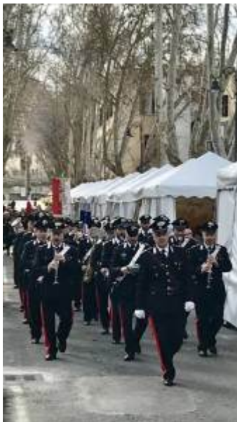
Carabinieri a Fiera Nazionale di Grottaferrata 2017

Aprire sotto i migliori auspici la 417° edizione della Fiera Nazionale di Grottaferrata con il taglio del nastro e la cerimonia inaugurale, alla presenza del Commissario prefettizio Giacomo Barbato, accompagnato dal vescovo della diocesi tuscolana monsignor Raffaello Martinelli e dall'amministratore apostolico del monastero esarchico di San Nilo, monsignor Marcello Semeraro, tutte le autorità civili, religiose e militari, oltre ai rappresentanti della Regione Lazio e numerosi sindaci, assessori e consiglieri comunali dei Castelli Romani.