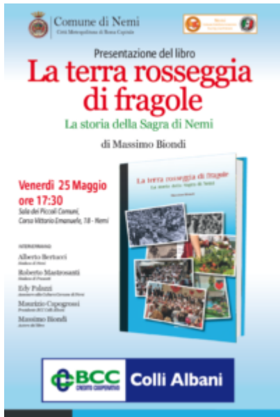
La terra rosseggia di fragole

VENERDI' 25 MAGGIO ORE 17.30 SALA DEI PICCOLI COMUNI NEMI CORSO VITTORI EMANUELE, 18