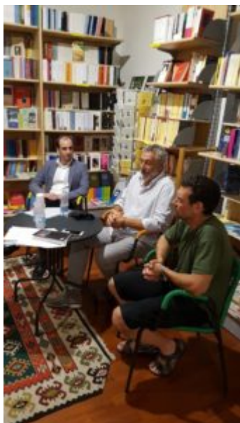
Presentazione Libro Pellegrini