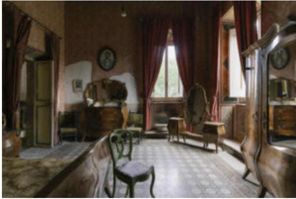
Villa Mergè a Frascati