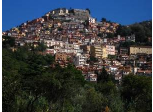
Vista di Rocca di Papa